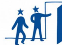
9. SPACE AND PARTICIPATION FOR ALL