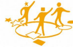
3. INCLUSIVE SOCIETIES