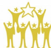
11. YOUTH ORGANISATIONS & EUROPEAN PROGRAMMES