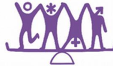
2. EQUALITY OF ALL GENDERS