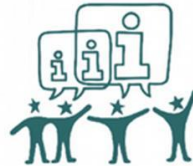
4. INFORMATION & CONSTRUCTIVE DIALOGUE