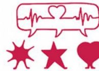
5. MENTAL HEALTH & WELLBEING