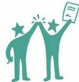
7. QUALITY EMPLOYMENT FOR ALL